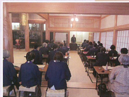
梅花特派布教の様子 (長楽寺)