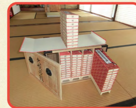
※修復完成イメージ